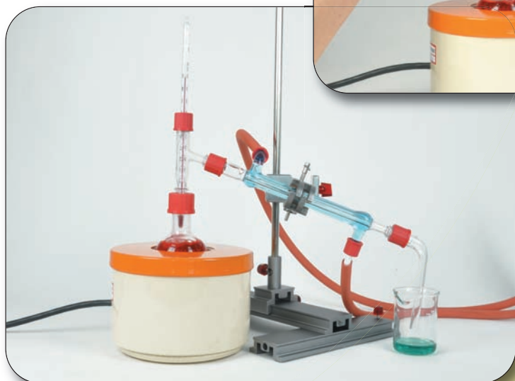
Destillatie met stoom